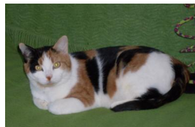
RIKA – 9 ans Très, très craintive

POUR NOUS AIDER - PAR EXEMPLE - A SOIGNER DES CHATS MALADES, OU DES CHATS TRES, TRES CRAINTIFS, DONC DIFFICILEMENT ADOPTABLES