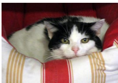
CHANEL – 13 ans Très, très craintive

VOUS NE POUVEZ OU NE VOULEZ ADOPTER UN CHAT,