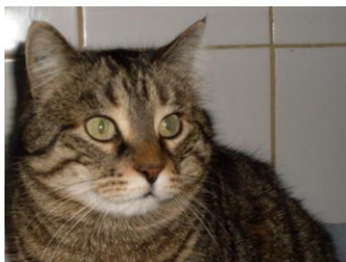
CHEYENNE – 12 ans Arthrose